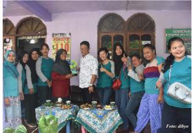
Pengelola PAUD foto bersama Ketua DPRD.