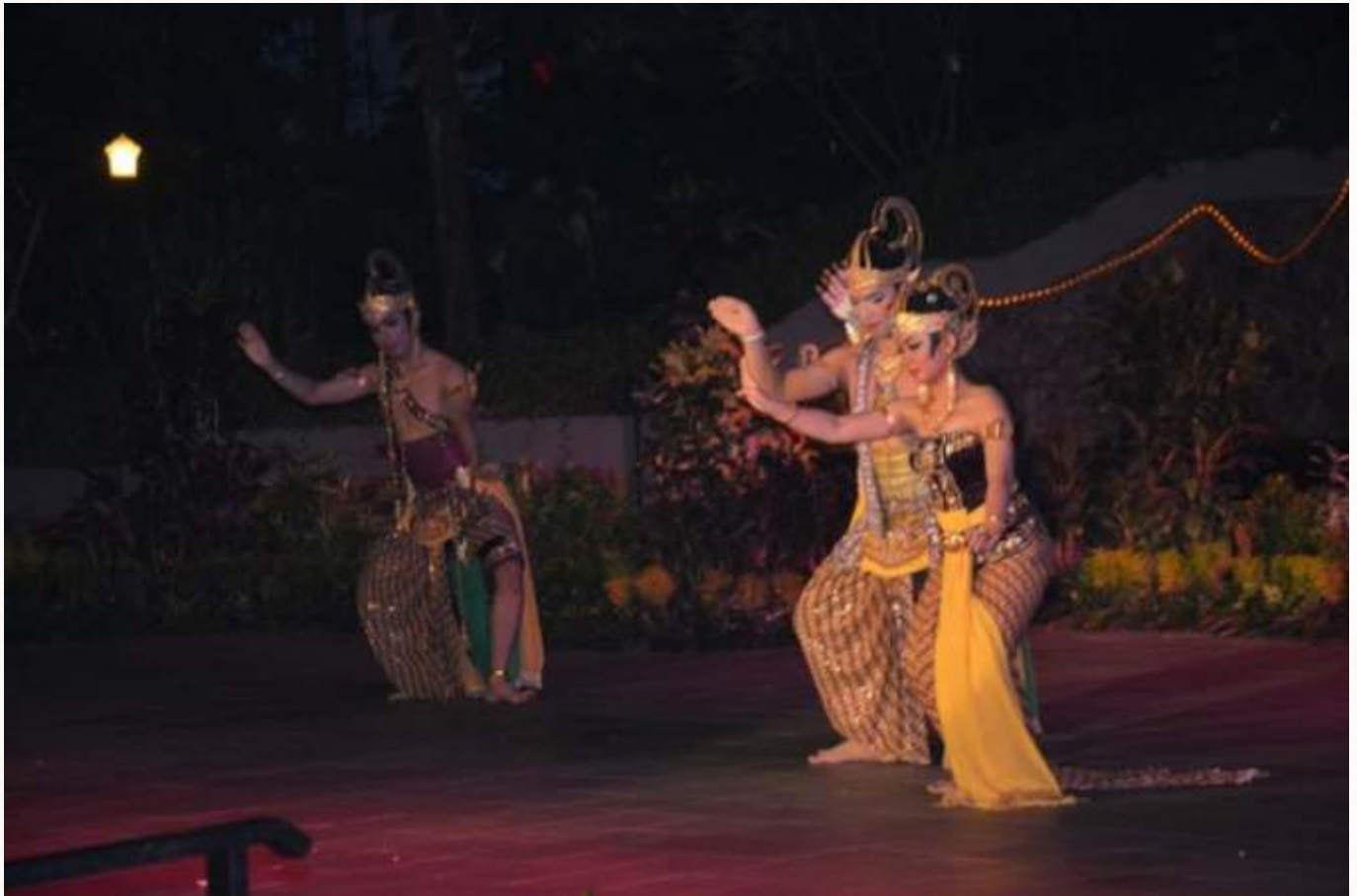
Pagelaran Sendratari Ramayana dengan judul "Banjaran Shinta"

P ara duta besar negara asing mengaku terpukau menyaksikan Pentas Seni Budaya oleh perwakilan Kota Salatiga berupa Pergelaran Sendratari Ramayana dengan judul "Banjaran Shinta", di Anjungan Jawa Tengah Taman Mini Indonesia Indah ( TMII) Jakarta. Duta besar asing yang hadir antara lain Irak, Australia, Amerika Serikat, China, Arab Saudi, Perancis, Jepang, dan Suriname.