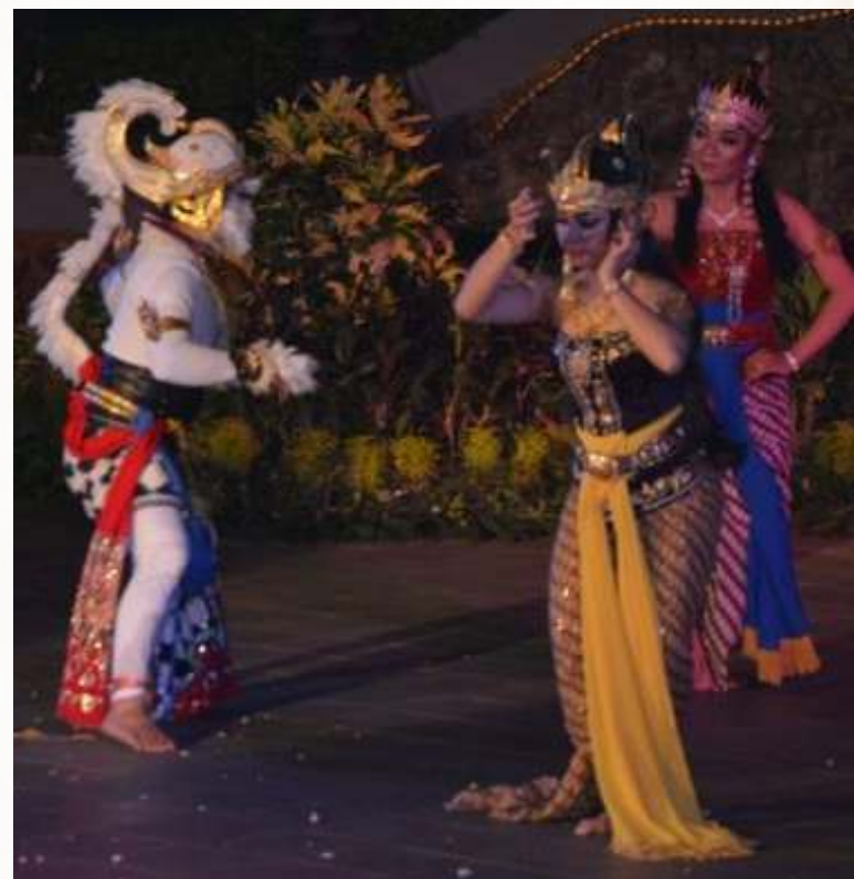
Pagelaran Sendratari Ramayana dengan judul "Banjaran Shinta"

bahwa Salatiga memiliki potensi seni budaya yang bisa diandalkan. Oleh karenanya saya berharap agar Pemerintah Kota Salatiga memberikan perhatian lebih kepada sektor seni budaya," pinta Bagas. ( lukman fahmi/ss )