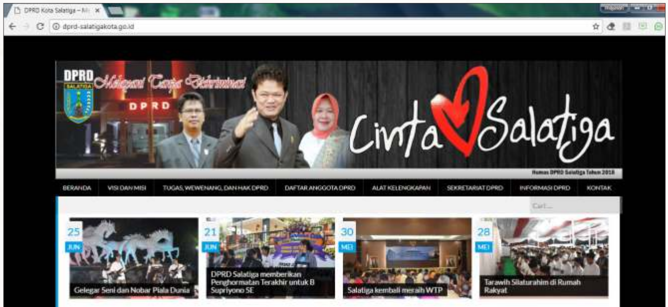
Situs/website resmi DPRD Kota Salatiga