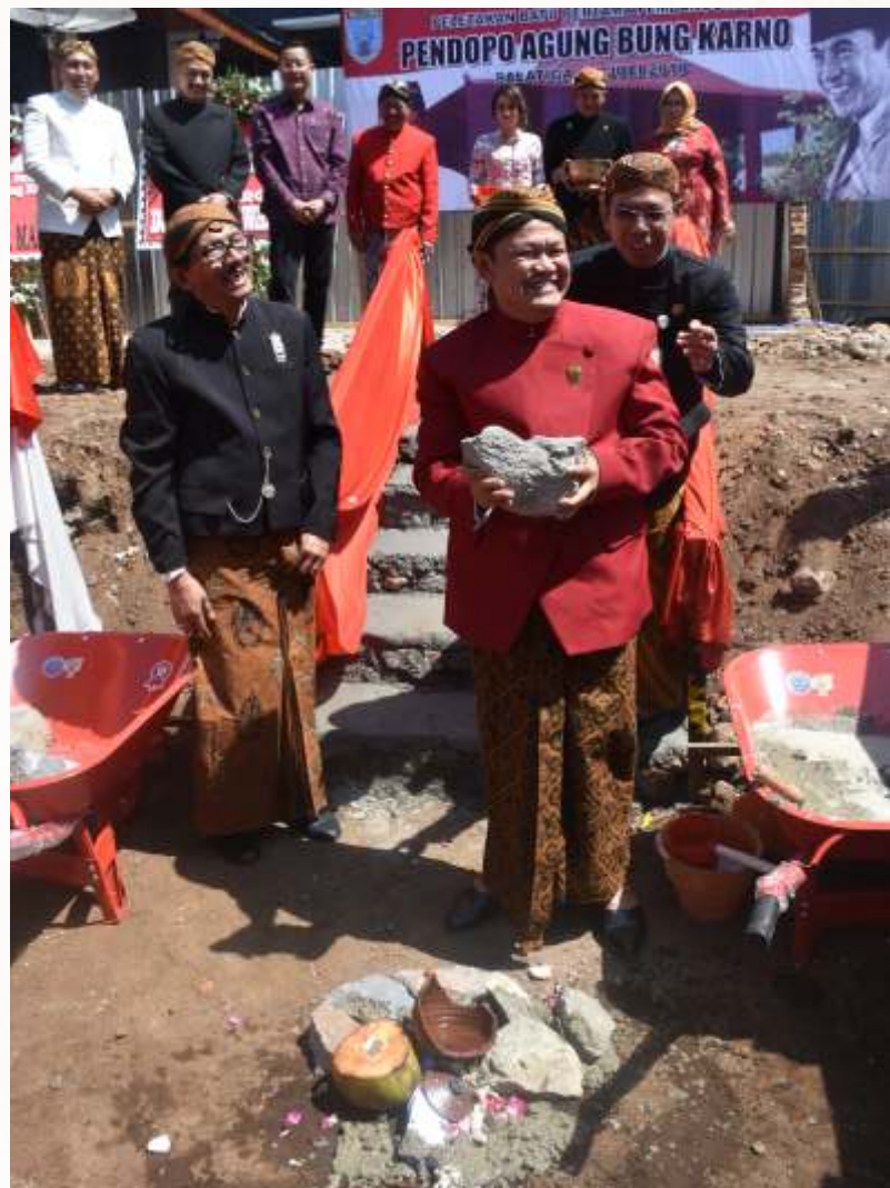
Ketua DPRD saat meletakkan batu pertama.

Pendapa Agung Bung Karno tentunya akan menjadi salah satu ikon Kota Salatiga. Pendapa yang dilengkapi dengan Patung Bung Karno itu pun diharapkan kelak menjadi objek wisata dan tempat