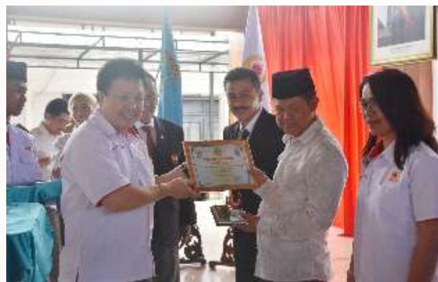
Ketua DPRD saat menerima penghargaan dari KONI.