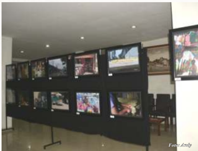
Pameran Foto di Kantor DPRD Kota Salatiga

Salatiga Fotografi dan Komunitas Migunani mengadakan Talkshow dan Pameran Fotografi dengan tema Salatiga dalam Bingkai Kebangsaan di Rumah Rakyat Gedung DPRD Kota Salatiga 19-20/6.