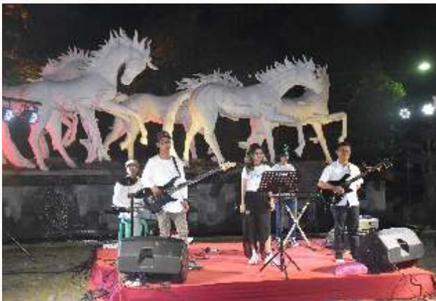
Pemain band Salatiga unjuk kebolehan dalam Gelegar Seni di Halaman Kantor DPRD.

D ewan Perwakilan daerah (DPRD) Kota Salatiga bekerjasama dengan Dinas Kebudayaan dan Pariwisata serta Komunitas Mobil Salatiga (KOMOSA) menggelar event Gelegar Seni Budaya yang dilanjutkan dengan nonton bareng Piala Dunia di halaman Kantor DPRD Kota Salatiga, Jumat (22/6). Rangkaian acara yang dimulai sore hari tersebut