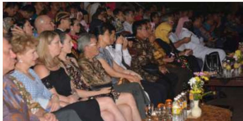
Para duta besar negara asing mengaku terpukau

Selain Pergelaran Sendratari Ramayana, di tempat yang sama juga digelar pertunjukkan wayang kulit dalang bocah dan pameran produk lokal asal kota Salatiga.