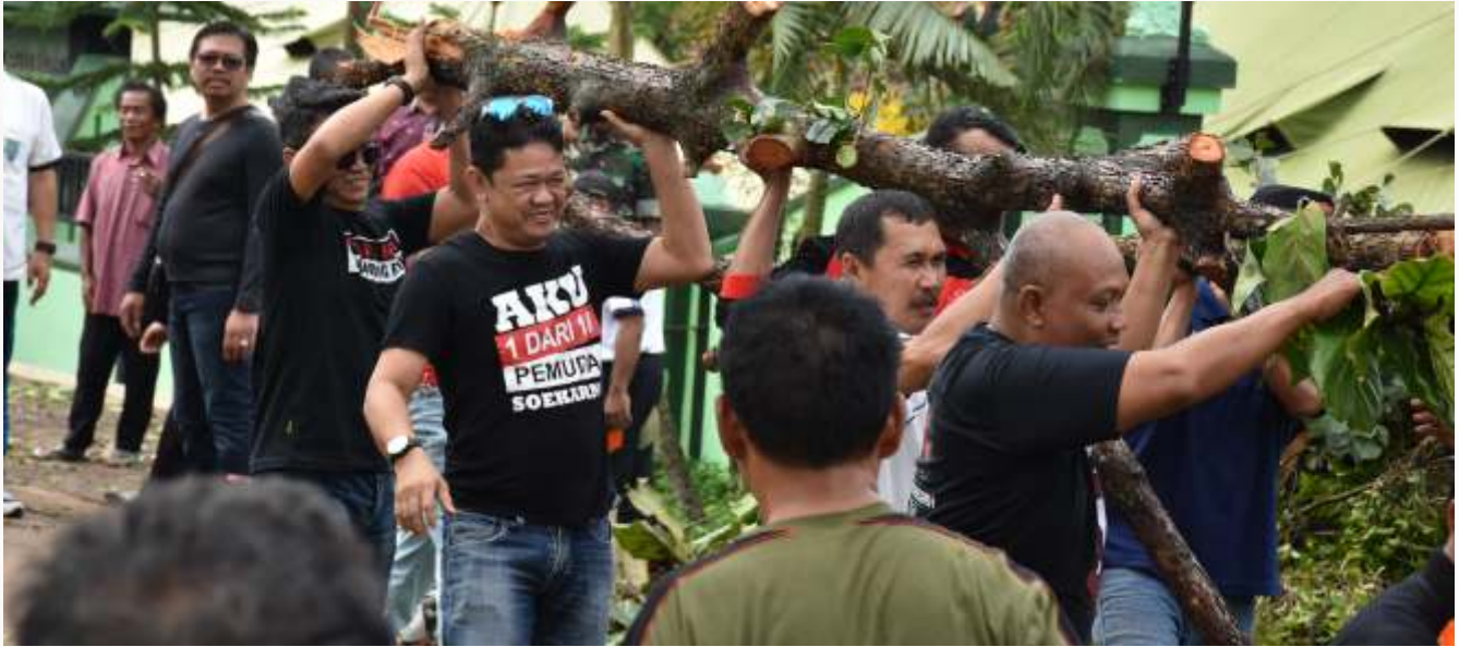
Ketua DPRD saat membantu masyarakat membersihkan ranting pohon akibat bencana angin.

Indonesia adalah satu negara yang rawan akan terjadi bencana, karena mempunyai posisi geografis yang terletak di ujung pergerakan tiga lempeng dunia: Eurasia, Indo-Australia dan Pasifik. Indonesia merupakan bagian dari Ring Of Fire (Cincin Api) yakni negara yang memiliki cukup banyak gunung berapi aktif.