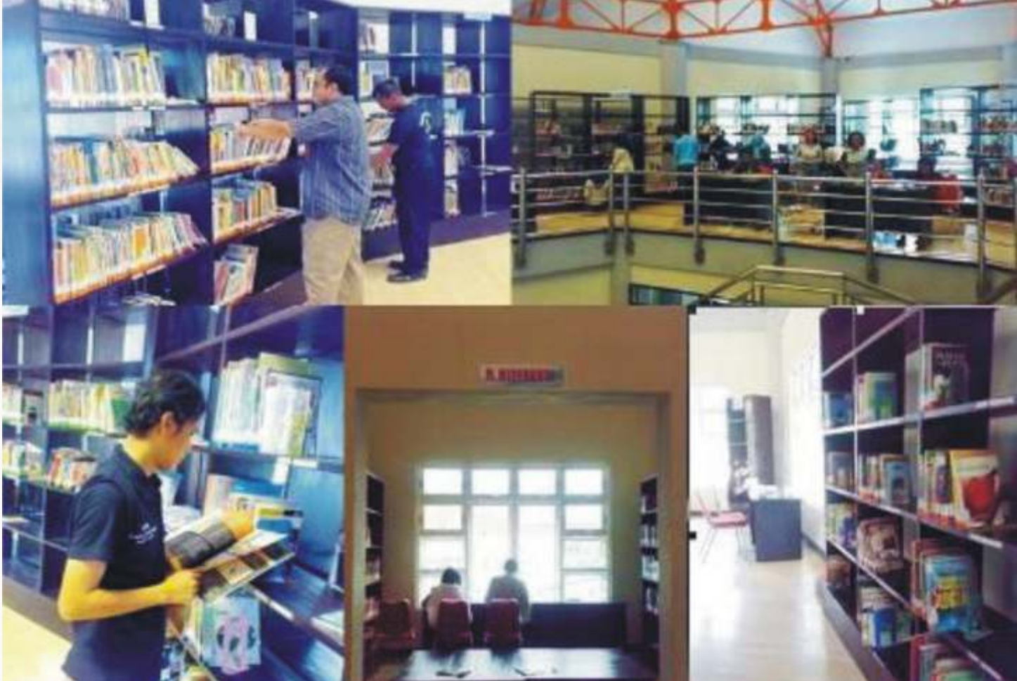
Perpustakaan Daerah Kota Salatiga memberi layanan masyarakat untuk membaca. Buka mulai hari Senin hingga Minggu. Setiap hari Senin-Jumat, buka mulai pukul 08.00 – 20.00, hari Sabtu-Minggu, jam 08.00 hingga 16.00.

tidak dapat dilupakan. Memberikan contoh langsung adalah cara terbaik dalam menumbuhkan minat membaca dalam keluarga. Inilah yang dalam sistem among yang dicetuskan oleh Ki Hajar Dewantara disebut dengan “ing ngarsa sung tuladha”. Orang tua sebagai pemimpin dalam rumah tangga wajib memberikan contoh (tuladha) secara langsung sehingga anak terbiasa membaca dan mendiskusikan bacaannya dengan orang tua. Orang tua juga harus melatih rasa ingin tahu anak, bukan mendiktenya sehingga anak akan memiliki daya kreativitas yang lebih tinggi. Karena pada dasarnya membaca dapat mengembangkan kreativitas manusia. Selain itu, menumbuhkan minat baca dalam keluarga yang menjadi cikal bakal berkembangnya minat baca masyarakat dapat pula dilakukan dengan membudayakan memberi buku sebagai hadiah. Kedua, Perpustakaan. Perpustakaan memegang peranan yang sangat penting dalam menumbuhkan minat baca masyarakat. Di perpustakaan masyarakat dapat memperoleh informasi bacaan dan berbagai referensi yang dibutuhkan dengan cepat dan tepat. Peran perpustakaan tidak dapat digantikan oleh internet secara penuh. Peran perpustakaan tetap tidak dapat dipisahkan dari dunia membaca. Ketiga, peran pemerintah dalam mengembangkan minat baca masyarakat adalah dengan mendukung dan menyelenggarakan kegiatan yang berkaitan dengan tujuan tersebut, misalnya: lomba-lomba kepenulisan, pameran dan bedah buku, temu penulis, pelatihan kepenulisan, dan lain-lain.