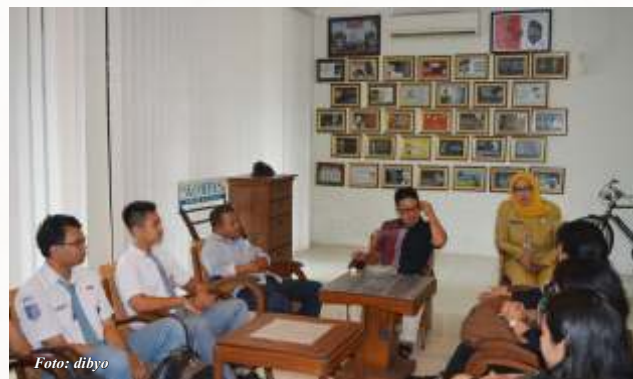
Siswa dan Guru SMA Kristen 1 Salatiga saat beraudiensi dengan Ketua DPRD Salatiga.

“Nanti disana, anak-anak akan melakukan presentasi mengenai Kota Salatiga dan juga