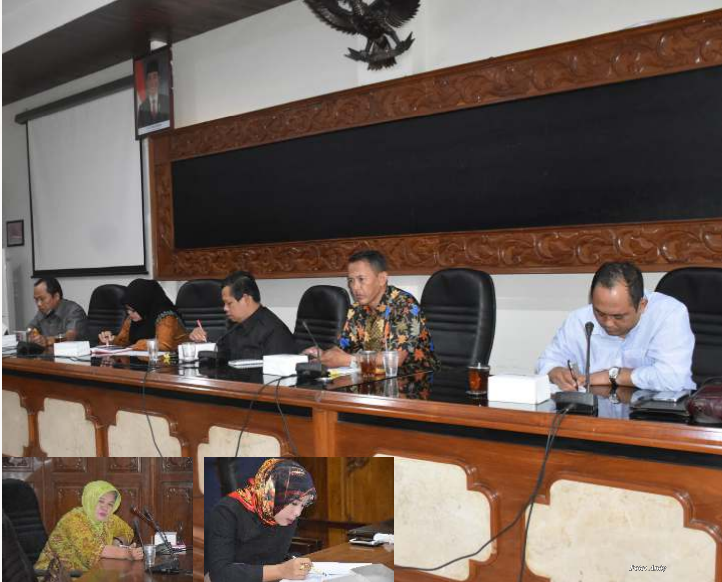
Rapat Komisi B DPRD Kota Salatiga di ruang Nusantara.

Belanja Daerah) dari Pemkot guna mendukung penanggulangan bencana yang membutuhkan biaya yang tidak sedikit.” Ucap Legislator dari Sidorejo ini.