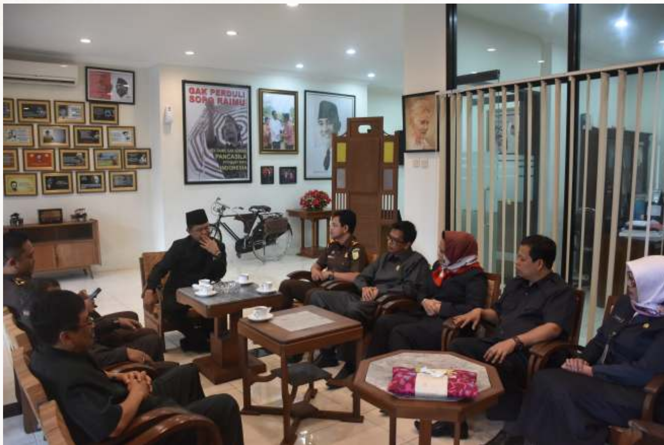
Pimpinan dan Anggota DPRD menerima Kunjungan Kepala Kejaksaan Negeri Salatiga di Ruang Kerja Ketua DPRD Salatiga