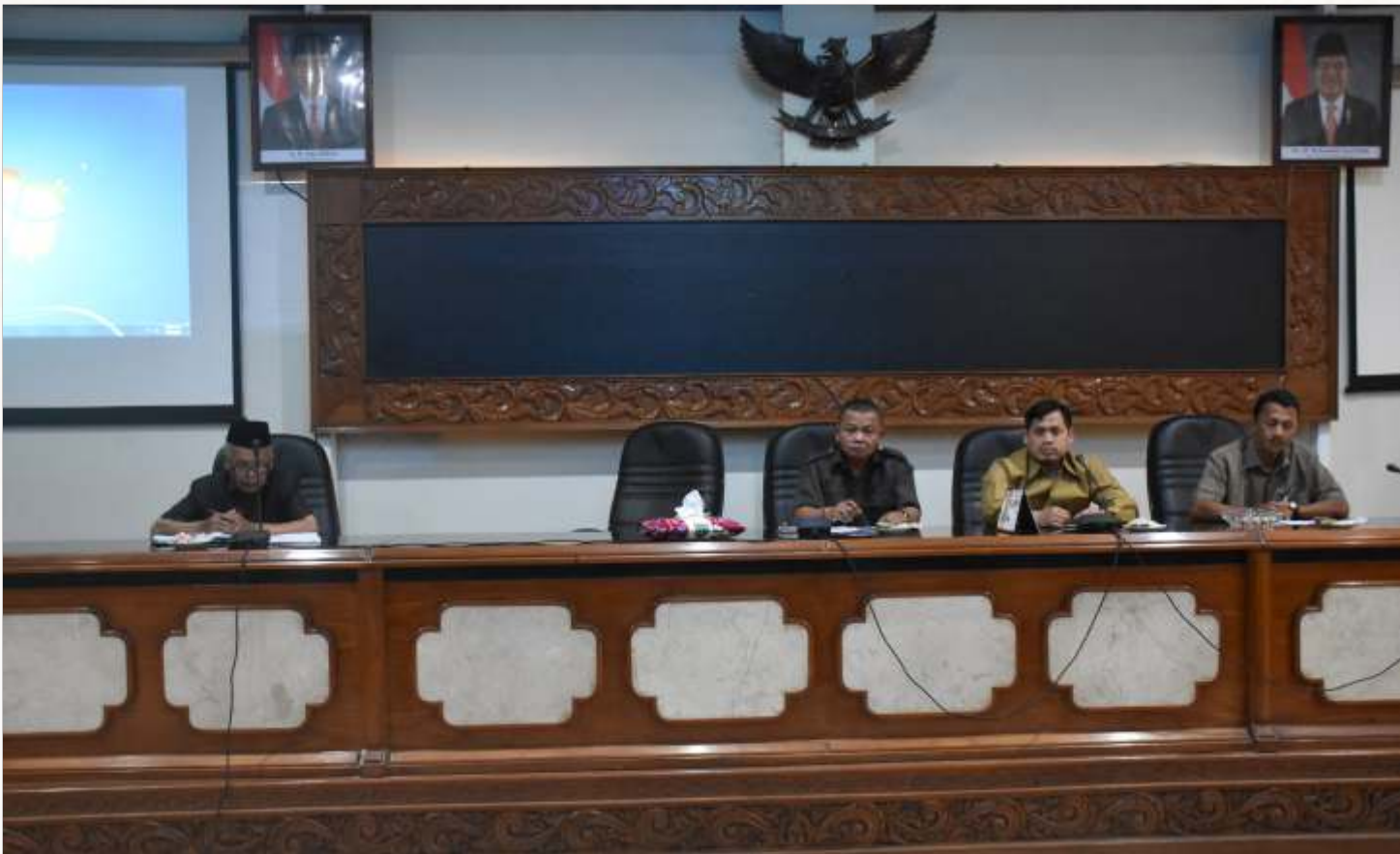
Rapat Komisi C DPRD Kota Salatiga di Ruang Nusantara Gedung DPRD Kota Salatiga.

wilayah perumahan mana wilayah untuk pengembangan pemukiman, ijinnya juga harus jelas dan terukur berapa biaya, waktu penyelesaiannya dan prosedurnya seperti apa” Kata Anggota Komisi C.